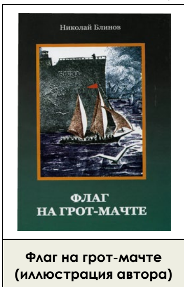
Флаг на грот-мачте (иллюстрация автора)

В России был еще и пятый запрет масонства: в 1918 году. Но об этом подробнее дальше.