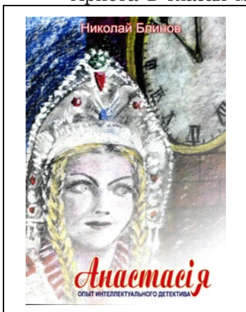
Анастасия (иллюстрация автора)

Но мало кто знает, что многочисленные ложи франк-масонов, свободных каменщиков, возникшие в XVII веке в Англии и действующие до сих пор по всему миру, главной задачей своей деятельности в течение нескольких веков считали и считают формирование нового человека, не хомо-советикуса, но скорее «хомо-масоникуса», творящего добро и справедливость.